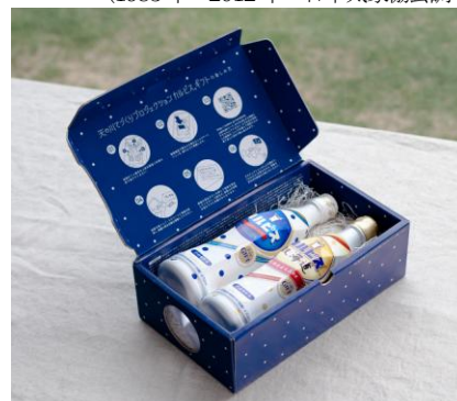
「天の川てづくりプロジェクト カルピス。ギフト」(イメージ)