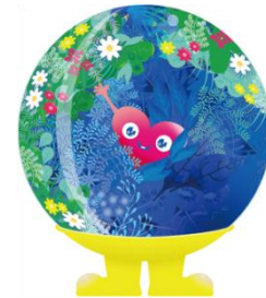
公式マスコットキャラクター 「トウキントウキ」