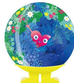
公式マスコットキャラクター 「トゥンクトゥンク」