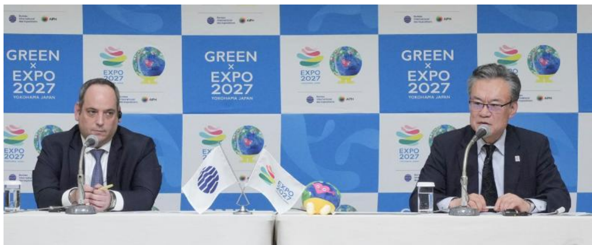
共同記者会見の様子