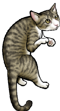
UR「サバトラ猫」スキル:チェーン強化 70%

「漢スロット10連」「姫スロット10連」が初登場！さらにおまけでSR確定チケット1枚もついてくる、超お得なスロットです！今回、目玉となる装備品は大人気動物シリーズ最新作の「サバトラ猫」「猫ぬいぐるみ」。その他、魅力的な装備品が盛りだくさん！