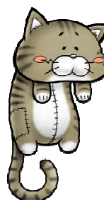
SR「猫ぬいぐるみ」スキル:チェーン強化 60%