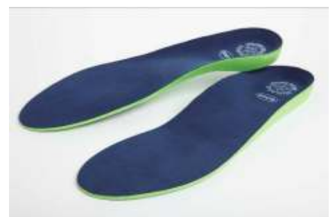
フルインソールタイプ