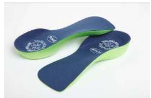
ハーフインソールタイプ