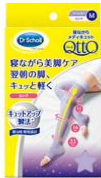
寝ながらメディキュット ロング