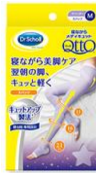
寝ながらメディキュット スパッツ