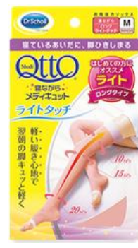
寝ながらメディキュット ライトタッチロング