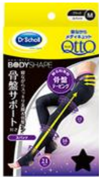
メディキュット ボディシェイプ スパッツ 骨盤サポート付き