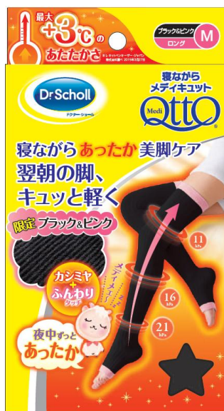
寝ながらメディキュット ロング ずっとあったか ブラック&ピンク