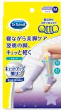
寝ながらメディキュット ショート