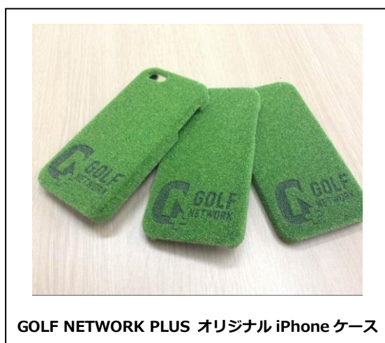
GOLF NETWORK PLUS オリジナル iPhone ケース

※その他、ゴルフネットワークオリジナルグッズ含めて総計50名様にプレゼントを実施。