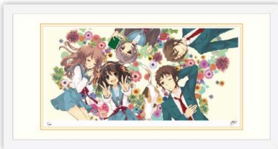
版画1/ハルヒ百花表紙イラスト（額サイズ：330mm×630mm） 税込46,400円

限定数は1作品につき、国内版300枚、インターナショナル版100枚販売いたします。