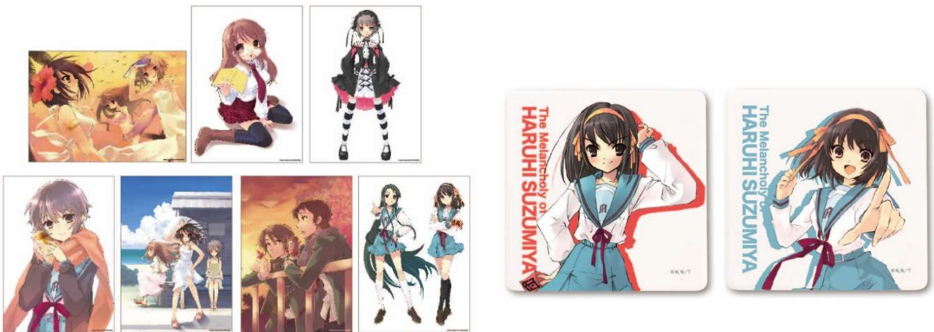
アートプリント (全7種) 各税込 1,100 円