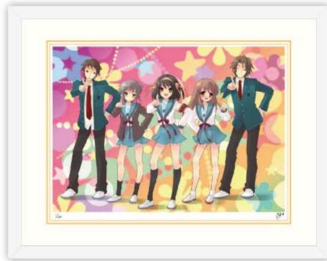
版画 3/「ザ・スニーカー」2006年8月号イラスト (額サイズ:424mm×539mm) 税込 41,800 円