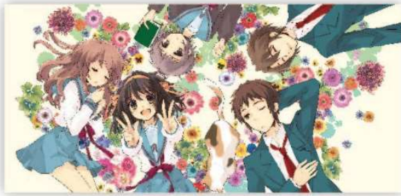
◀ 画集「ハルヒ百花」表紙イラスト