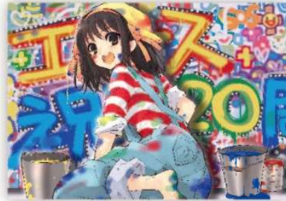
▶ 「少年エース」20周年祝いイラスト