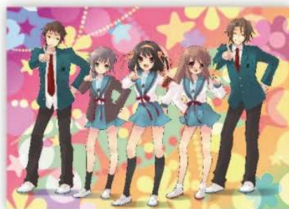
◀「ザ・スニーカー」用イラスト 2006年8月号