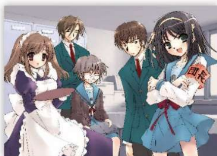
◀「ザ・スニーカー」用イラスト 2003年6月号