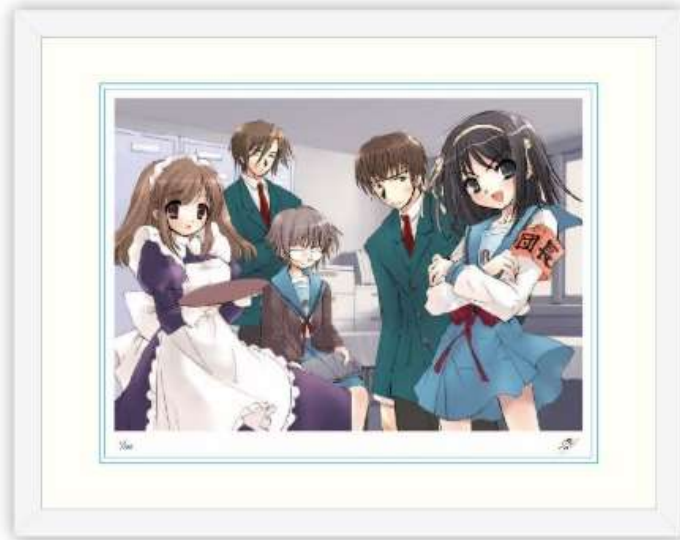
版画 2/「ザ・スニーカー」2003年6月号イラスト (額サイズ:424mm×539mm) 税込 41,800 円