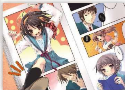
「ザ・スニーカー」用イラスト 2004年4月号▶