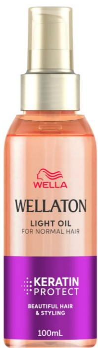
ウエラトーン ライトオイル ＜さらさらタイプ＞