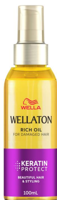
ウエラトーン リッチオイル ＜しっとりタイプ＞