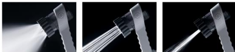
トルネードミスト