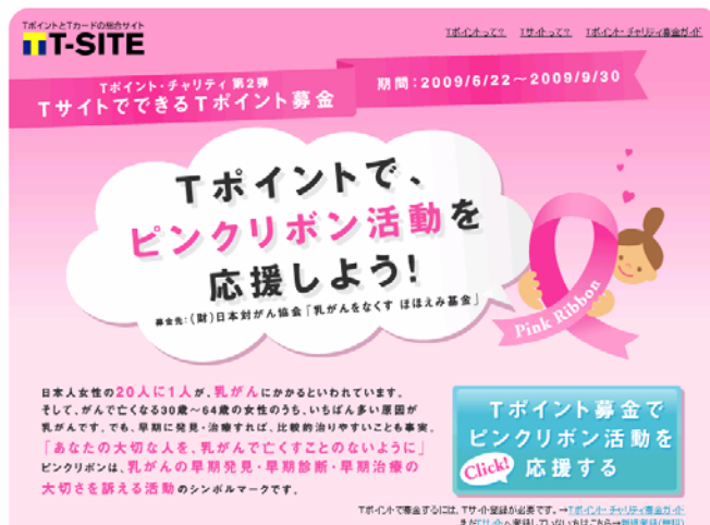
※【PC】T サイト 画面

※ほほえみ基金への募金は、10 月末にTポイントを運営する株式会社 CCC が代表して行う予定です。