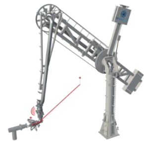
図1：非接触式自動接続システム「CHOKUSEN」イメージ