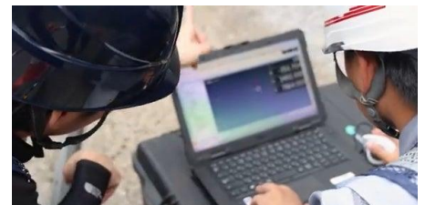
現場での操作の様子

橋梁メーカーにおける仮組立工程の削減ニーズを踏まえ開発した橋梁専用の部材検査および仮組立シミュレーションソフトウェアです。高精度なバーチャル仮組立シミュレーション機能により、物理的な仮組立工程を大幅に削減します。現場ではタブレットを活用した測定により、測定手順の作成からデータ解析までを現場内で完結できる運用を実現します。