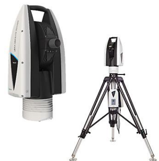
Leica Absolute Tracker ATS600 レーザートラッカー