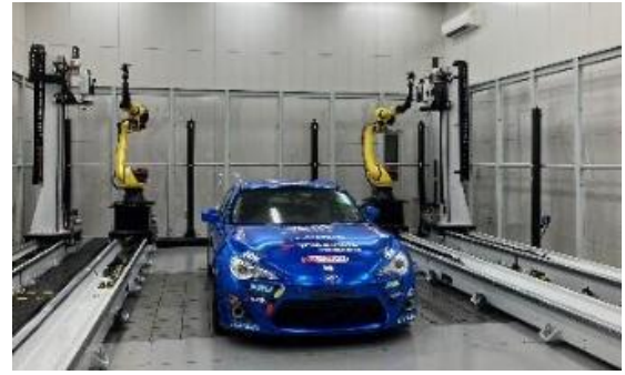
TTS 厚木テクニカルセンターの様子

東京貿易テクノシステム株式会社（TTS）は、三次元測定機やレーザートラッカーなどの高精度な計測機器を提供し、製造業のスマートマニュファクチャリングを支援する企業です。主な事業は、計測機器の販売・技術サポート・ソフトウェア開発・エンジニアリングサービスで、自動車業界、建築業界、鉄鋼業界などの大手メーカーから航空宇宙、重工業、研究機関まで、ものづくりの現場における製品の設計、品質管理、製造プロセスの最適化を支援しています。