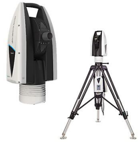
Leica Absolute Tracker ATS600

レーザートラッカーを使用し、橋脚の鋼板とコンクリート躯体間の寸法を遠隔から高精度かつリアルタイムに計測するアプリケーションです。 角柱・丸柱・門型角柱の三種の橋脚タイプに対応しています。