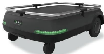
協働運搬ロボット CoRoCo

『全国知財創造実践甲子園』は 2020 年の第一回から知的創造サイクルの観点を重視し、これら課題の解決に資することを目的とし、参加する学生は、各々の実践を知的財産の視点で見つめ直し、発表や共有で学び合うことで新たな創発の機会に繋がっています。