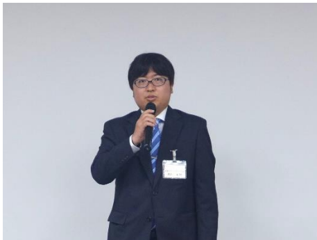
日本アドバンスロール（株）

今回の講演会出場は、日本鑄鍛鋼会 鍛鋼・製鋼研究部会における今年度の数ある事例発表の中から部会主査より推薦を受けたものであり、更に日本鑄鍛鋼会の鍛鋼・製鋼研究部会、鍛鋼研究部会、機械加工部会からそれぞれ選ばれた優秀発表の中から選ばれたものが最優秀エンジニア賞となる、非常に栄えある賞です。