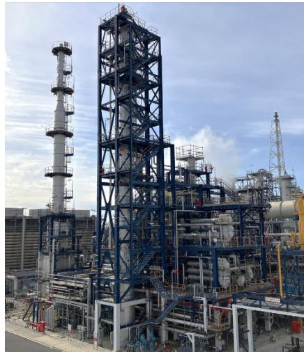
SAF 製造設備（2024年12月撮影）

※1 NEDO ウェブサイト https://www.nedo.go.jp/koubo/FF3_100312.html