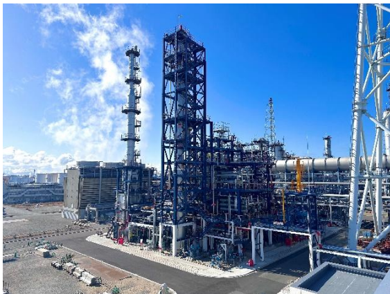
建設が完了した SAF 製造装置 （コスモ石油堺製油所構内）

※NEDO ホームページ： https://www.nedo.go.jp/koubo/FF3_100312.html