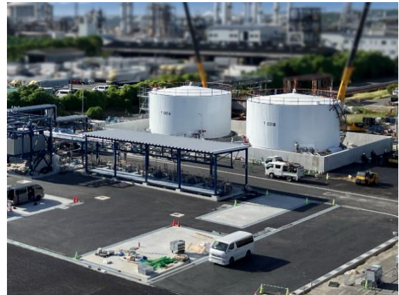
SAF の原料となる廃食用油受け入れ施設 （コスモ石油堺製油所構内）