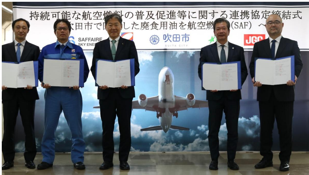
協定締結式の様子

なお、本協定に基づいて吹田市が SAF の原料向けに提供する廃食用油は年間でおおよそ27,000 リットルを見込んでいます。これは、自治体が SAF 原料に再資源化していく排出量としては、全国で最大となる見込みです。