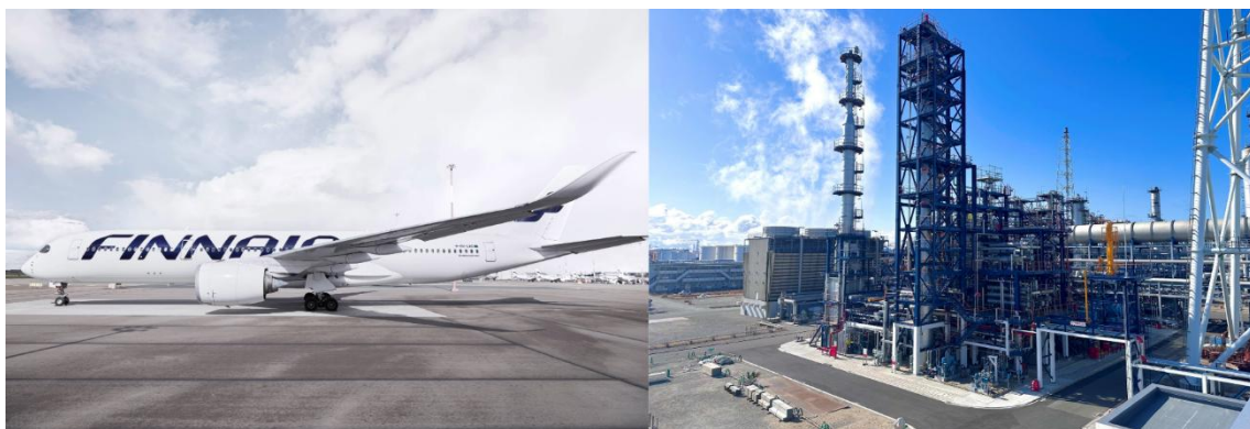
フィンエアーの機体と SAF 製造装置（コスモ石油堺製油所構内）