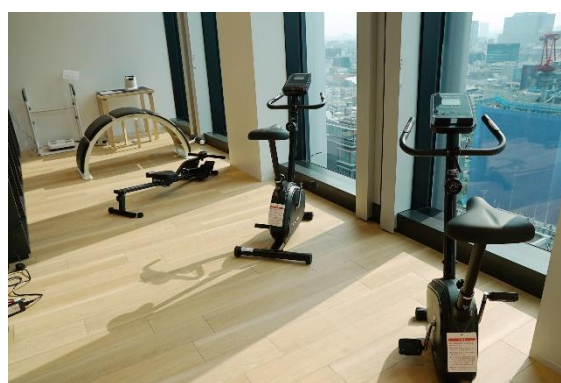
社員が自由に利用できるウェルネスエリア