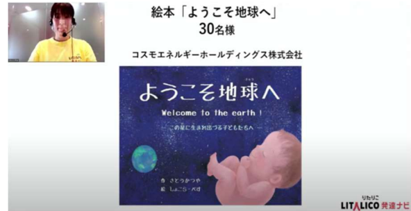
LITALICO 発達ナビのイベント 「オンラインまなびフェスタ」 で絵本が紹介される様子