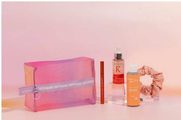
My Little Box 公式サイト www.mylittlebox.jp

公式サイトでは、2024年5月1日より5月BOXの販売を開始。テーマは、1日の過ごし方に着目した“SUNRISE TO SUNSET”。お届けするライフスタイルアクセサリは、美しいグラデーションが特徴的なメッシュポーチ。夕暮れの空からインスピレーションを受けたデザインです。注目の「KERASTASE」のヘアセラム、「LUMIURGLAS」のアイライナー、オリジナルのスキンケアアイテムに加え、ヘアアクセサリをすべてポーチに詰めてお届けします。