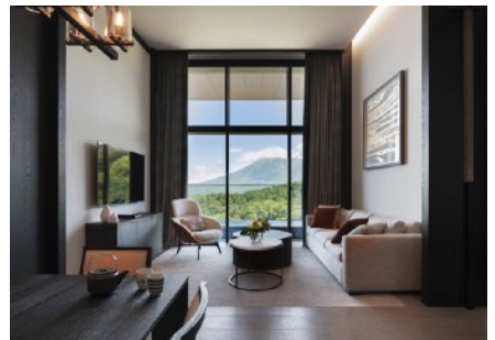
パーク ハイアット ニセコ HANAZONO