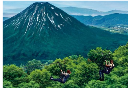
HANAZONOジップワールド完成予想図