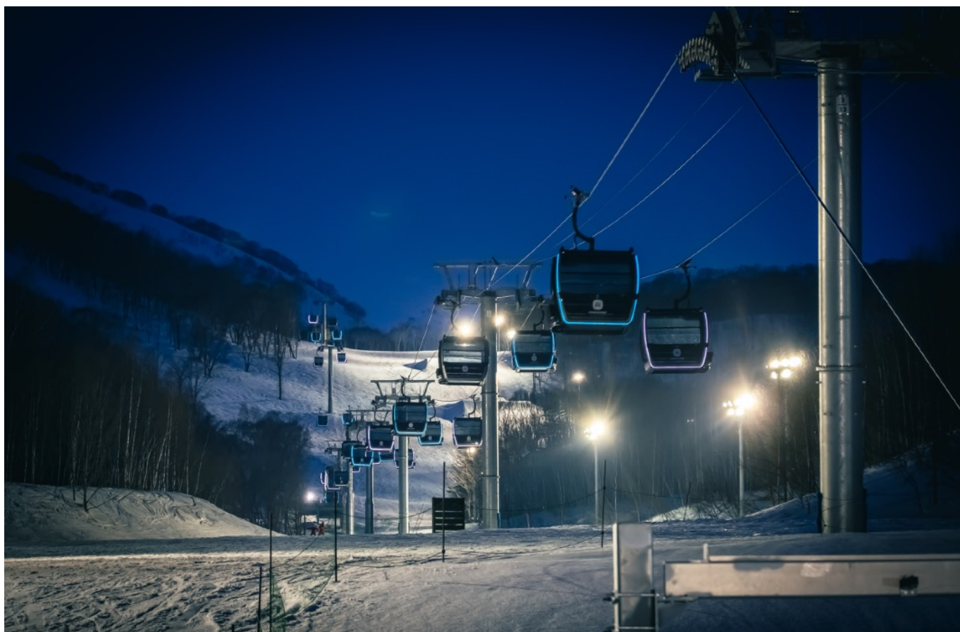
写真: 冬季の HANAZONO シンフォニーゴンドラの様子。この斜面が Mountain Lights に彩られる。