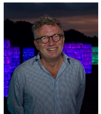
ブルース・マンロー © Bruce Munro Studio