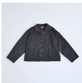
コーデュロイ ジャケット 38,500円