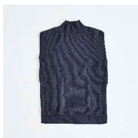
ウールセーター ベスト 15,400円