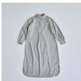
ワンピース シャツ 35,200円