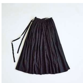
ギャザースカート 30,800円