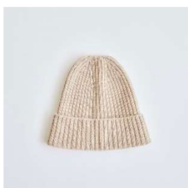
カシミア ニット ハット 9,900円

※商品価格は税込価格です。掲載情報については、予告なく発売日、価格などの情報の変更がある場合がございます。予めご了承ください。