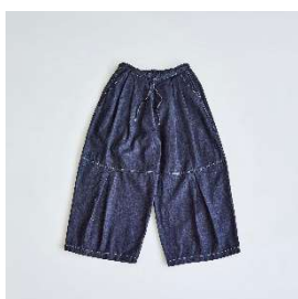
デニム ワイド パンツ 25,300円