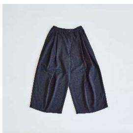
ワイド パンツ 28,600円