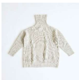
ウールタートルネック セーター 19,800円