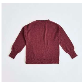
ウールセーター 15,400円