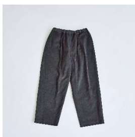
コーデュロイ パンツ 28,600円