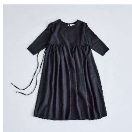
ギャザーワンピース 38,500円