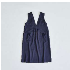
エプロン ドレス 30,800円