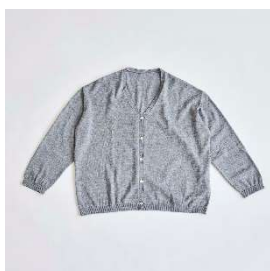
ウールカーディガン 17,600円