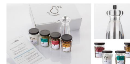
自分だけの調味料 で料理を作る