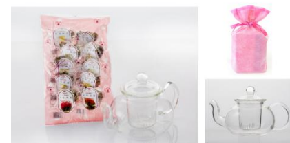
ゆっくり楽しみながら、 積もる話をしよう。