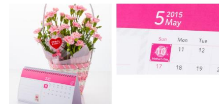
いつもリラックス している場所に、 飾ってほしい