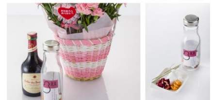
自分なりに作った サングリアを味わう