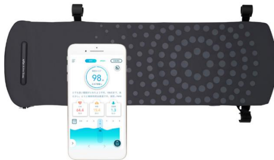
Active Sleep ANALYZER

本契約に基づき、当社はラグビー日本代表が宿泊する JAPAN BASE の居室全室に、睡眠計測センサー「Active Sleep ANALYZER※」を導入いたします。