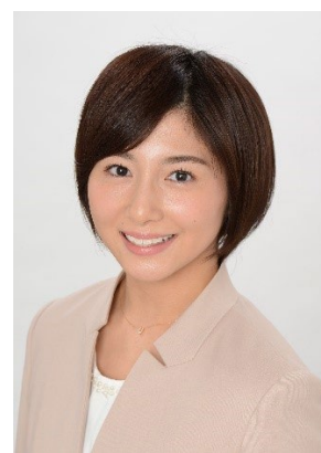
日テレ 市来玲奈 アナウンサー