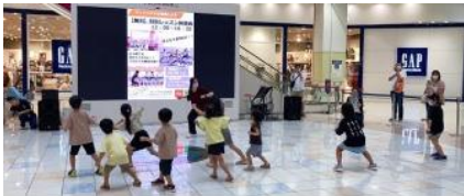
近隣商業施設での様々な健康 レッスンの体験会