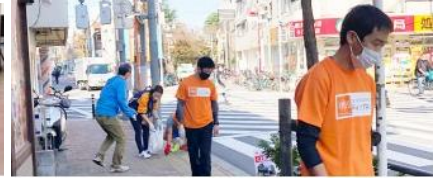
ティップネスのある街、皆さまの暮らす街を キレイにするクリーン活動