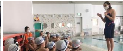
ナショナルクラスの選手を招いての レッスンや講演