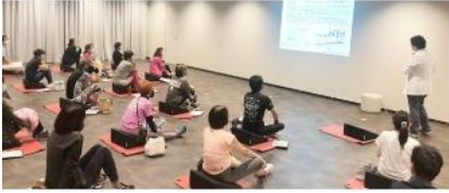
各界著名人や医師・専門家を招いての セミナー・ワークショップ開催