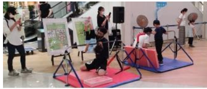
お子さまの成長のために、運動機会と 「できた！」のご提供