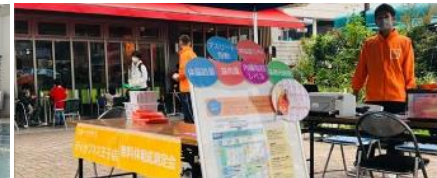
街角にお邪魔して、健康測定や 相談会の実施

“OPEN TIPNESS”についてはこちらをご覧ください > https://www.tipness.co.jp/opentipness/