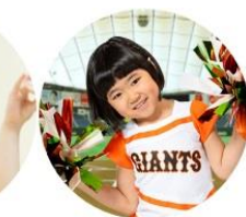
ジャイアンツ ヴィーナス ダンススクール

近年はキッズ向けダンスプログラムへのニーズの高まりが顕著で、それに応える形で急速にバリエーションが広がっています。