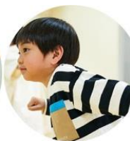
ストリートダンス