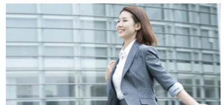
駅近の好アクセス！