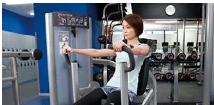
マシンジム特化型！