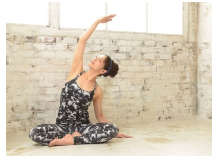
柔軟性向上、血流促進も