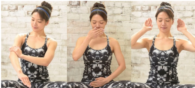
身体・呼吸・音に集中するオリジナル「マインドフル瞑想」が特徴

全45分間のプログラムを通じ、様々なアプローチで集中状態を作り出していきますが、最も特徴的なのは、7分間の「オリジナル マインドフル瞑想パート」です。検証実験を行いつつ、環境・手順・音楽から実施時間に至るまで、誰もが集中しやすい形にパッケージ化し、レッスンの最初と最後に2度組み込みました。音楽には、癒し効果のある周波数とともに楽器の音、鳥の声、水の音などが所々に挿入されており、2回目で判別できる音が増えているかどうかで自身の変化を認識することができます。またこの『Mind Flow Yoga』は、ポーズの完成度を重視しないため、初心者や、身体が硬いからとヨガを敬遠する男性にも安心して参加いただける、現代人のための最先端ヨガプログラムです。