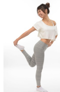
体操による腸の“間接刺激”