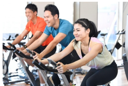
ジムで気軽に参加できる

『カーディオリカバリーHR』は、血流を最大化することで回復を促す、新感覚の心拍トレーニングです。ジム内のバイクやトレッドミル（ランニングマシン）を利用して行う 20 分のショートプログラムで、参加者は心拍計を装着し、自身の心拍数を計測・確認しながら、インストラクターの指導による専用プロトコルをこなします。高強度で短時間の心拍アップと、全身のダイナミックストレッチを交互に行うことで、血液循環を最大化し、細胞の回復に必要な酸素と栄養素をカラダの隅々まで送り届け、疲労に対する回復力を高めます。