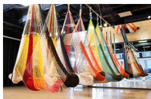
ハンモックエクササイズ