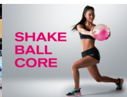
SHAKE BALL CORE