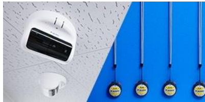
最高水準のセキュリティ！