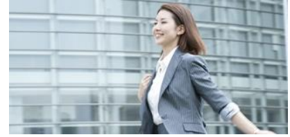
駅近の好アクセス！