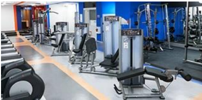
リーズナブルな月会費！