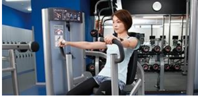
マシンジム特化型！

「FASTGYM24」は、従来型の総合フィットネスクラブではカバーしきれない多様なニーズに対応するため、ティップネスが2014年より展開を開始したマシンジムのメインとした24時間営業のトレーニングジムです。リーズナブルな月会費で「いつでも好きなときに好きなだけ利用できる」という手軽さと利便性を提供する新ブランドとして、都内および近郊に続々出店しています。