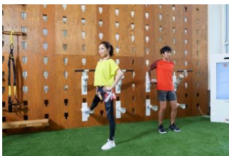
「ボディメトリクス」

「ゆるむ」「ほぐれる」「整う」をテーマにした「リカバリーエリア」。運動前後はもちろん、疲労回復だけの利用まで、「回復」を軸に、最適な「コンディショニング」を実践できます。