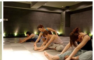
女性専用ホットスタジオ「HOTLUX」