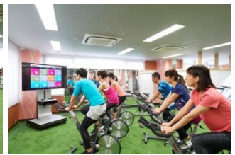
「心拍コントロールシステム」