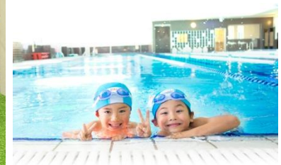
ティップネス木場 リニューアル後のフロアイメージ 子ども向け運動スクール「ティップネス・キッズ」

当社は昨年4月、運動偏重型だった従来のフィットネスクラブからの脱却をはかるため、「運動」「食事」「回復」をトータルでサポートするオリジナルメソッド『1WEEK コンディショニング』を、総合型クラブの全ブランドでスタートさせました。同時に、最適な環境でコンディショニングを実践するためのモデル店として、全館刷新したティップネス吉祥寺をオープンし、今、新たな形の“疲労回復系のジム”として注目を集めています。そしてこの度、その流れを引き継ぎ、回復系のコンテンツを一挙に導入し、ティップネス木場が「コンディショニング ジム」として生まれ変わります。