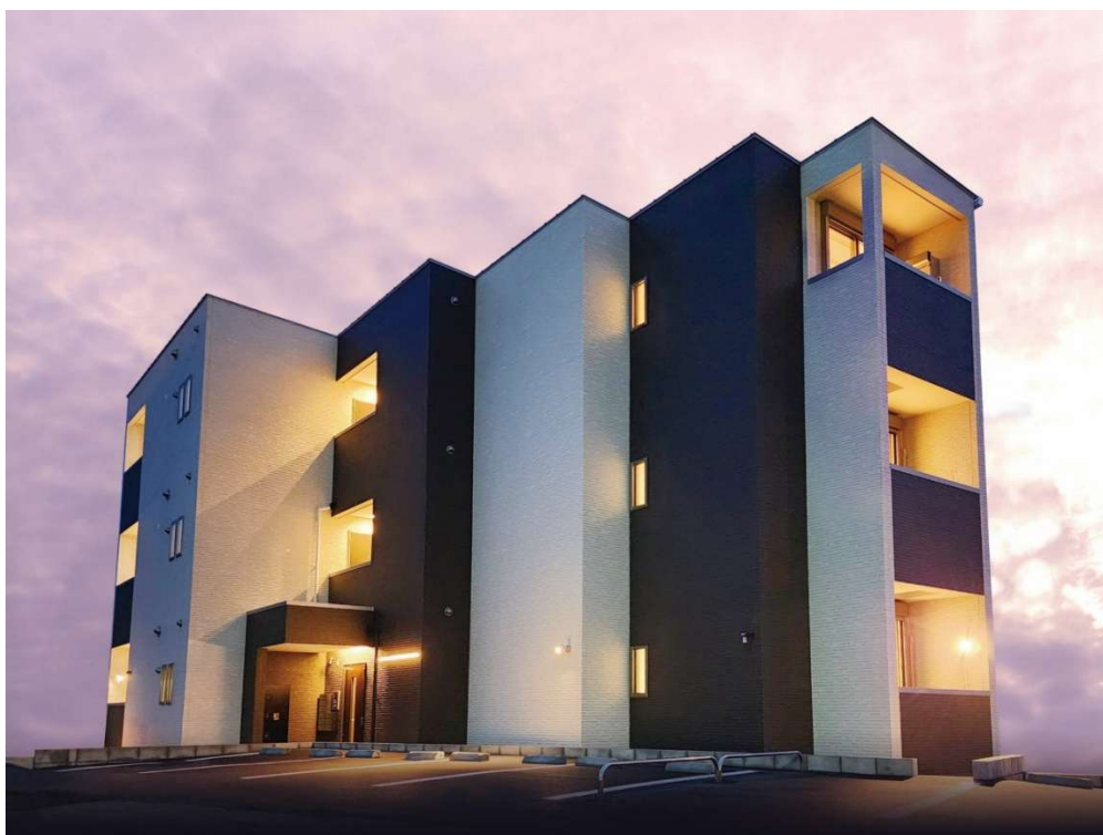
(アイケンジャパンのアパート(レガリストシリーズ))