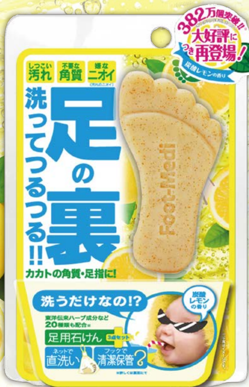
足用角質クリアハーブ石けん《炭酸レモンの香り》 内容量:60g 価格 839円(税抜)