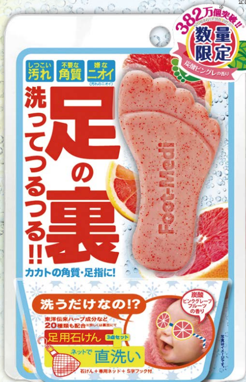
足用角質クリアハーブ石けん《炭酸ピンクグレーフルーツの香り》 内容量:60g 価格 839円(税抜)