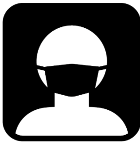
お客様のご来場時の 体調チェック・マスク着用をお願い

また本イベントは3密対策を考慮し、東京都の広大な屋外敷地の一部で実施する開放的なイベントとなっています。