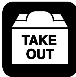
テイクアウトの実施・推進