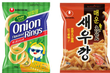
使用する韓国スナック菓子

韓国でも話題の“プリンクルソース”をオニオンリングと辛いえびせんんに添えてご提供。ディップしてお楽しみください。