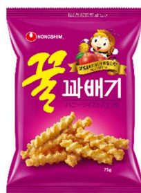
使用する韓国スナック菓子

“はちみつ×ミルク”の組み合わせで優しい甘さが特徴。ハニーツイストの食感がアクセントに。