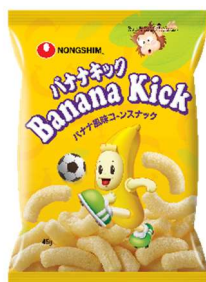
使用する韓国スナック菓子