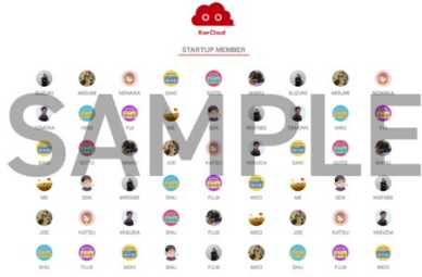
スタートアップメンバークレジットボード

希望のハンドルネームをご記載いただけます。ご自身のプロフィールページへのリンクを貼ることもできます。 ※支援時、必ず備考欄にスタートアップメンバークレジットボードに記載されるご希望のお名前をご記入ください。 ※目立たずひっそりと利用したい方はこちらの機能は利用しないことも可能です。(利用されない場合は備考欄に「ボード利用無し」とご記入ください。)