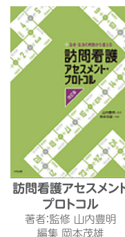
訪問看護アセスメント プロトコル 著者：監修 山内豊明 編集 岡本茂雄