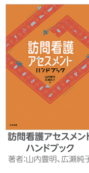
訪問看護アセスメント ハンドブック 著者：山内豊明、広瀬純子

どんなに想いを込めた看護でも、自分の頭の中にあるだけではもったいない。「看護のアイちゃん」は本物の看護を目指す事業所様を応援いたします！