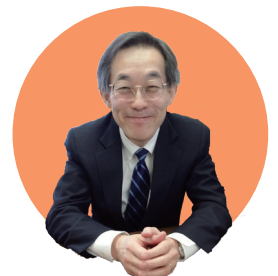
監修：山内 豊明教授 放送大学大学院 文化科学研究科 生活健康科学 教授 名古屋大学 名誉教授