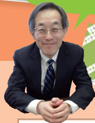
名古屋大学名誉教授 山内豊明先生監修 「訪問看護アセスメント・プロトコル」搭載