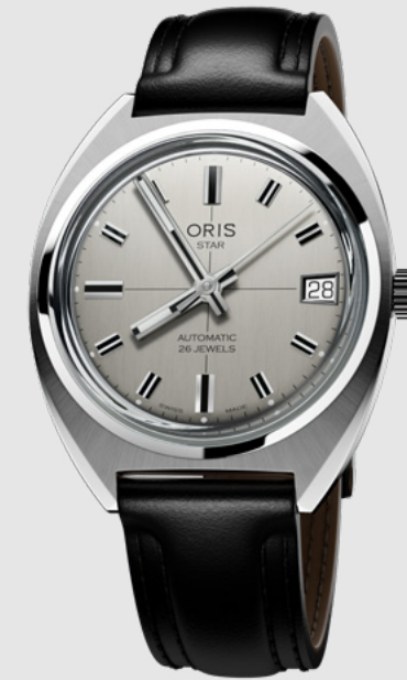
Oris Star Edition 733 7813 4151-07 5 17 02

キャリバー Oris Calibre 733 機能 センター時・分・秒針、日付表示、ストップセコンド 巻き上げ方式 自動巻き パワーリザーブ 約41時間 販売価格 363,000円(税込) 発売時期 5月