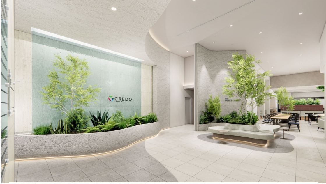
<「CREDO 野田」 エントランスおよびカフェテリア (右奥) イメージ>