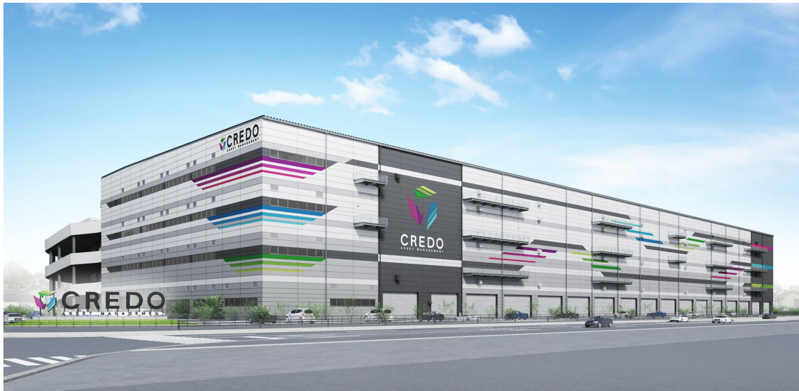
<「CREDO 野田」完成イメージ>

柏・野田エリアにおけるこれらのニーズを踏まえ、クレド・アセットマネジメントでは、同エリアにおいて次期プロジェクトの開発用地も確保しており、継続的な物流施設の供給を通じて、テナントの同エリアでの物流拠点拡張ニーズにも対応してまいります。