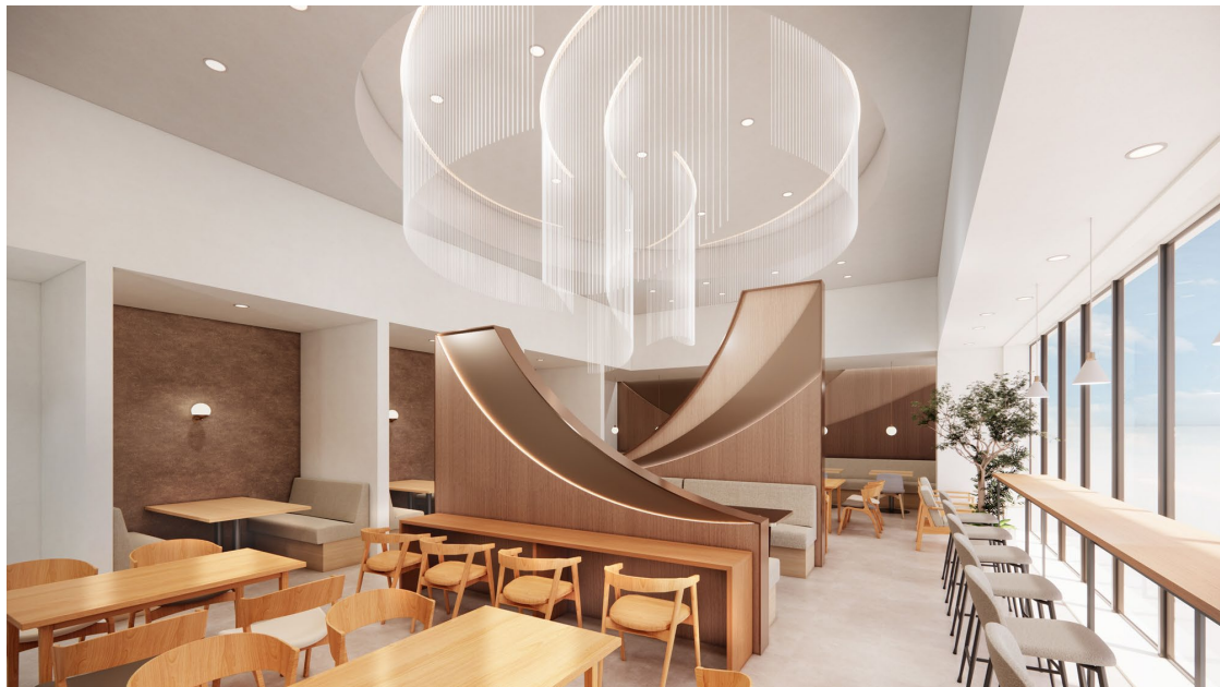
<「CREDO 野田」 4階カフェテリアイメージ>