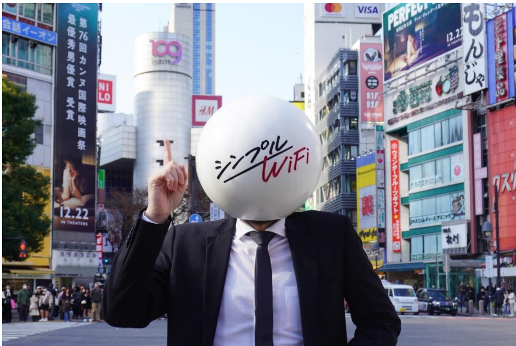
「シンプル WiFi」の公式キャラクター「シンプルマン」が Z 世代を追いかける！

そしてこの度、社会で複雑な悩みを抱えているだろう 40～50 代のアラフォー・アラフィフ世代の悩みについて WEB アンケートで調査。さらにその悩みについて Z 世代へアンサーを聞いてみるという「アラフォー・アラフィフ世代のお悩み×Z 世代シンプル化計画」を実施しましたので発表いたします。