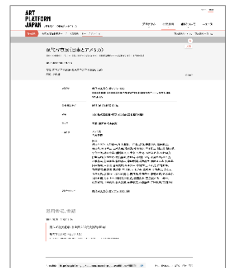
現代美術展データの例