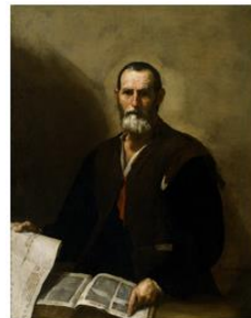
ジュゼベ・デ・リバーラ《哲学者クラーテス》 1636年 国立西洋美術館蔵

長崎県美術館において、同館所蔵の鴨居玲作品と国立西洋美術館所蔵のスペイン・バロックの巨匠ジュゼベ・デ・リバーラの作品を比較展示した「鴨居玲のスペイン時代」展（会期：2023年4月7日～6月11日）が、「コレクション・プラス」のプレ事業として開催されます。