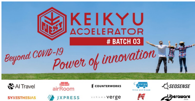
第3期メインビジュアル

「モビリティを軸とした豊かなライフスタイルの創出」を目指し、スタートアップ企業とのオープンイノベーションにより新規事業創出を目指すプログラム。第3期となる今期は、6月にAIトラベル含む参加企業10社の発表をおこないました。本プログラムの参加企業は、京急グループの事業基盤を活用したテストマーケティングを行いながら事業共創を図り、デジタル・テクノロジーを積極的に活用した、“with コロナ”，“after コロナ”時代の新たなモビリティとライフスタイルを生み出すイノベーションの創出を目指します。