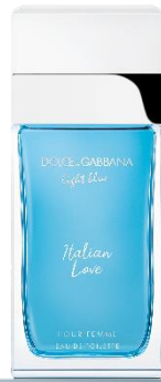
ライトブルー イタリアンラブ オードトワレ

25mL 7,000円(税込7,700円) 50mL 9,800円(税込10,780円) 100mL 13,100円(税込14,410円)