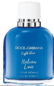
ライトブルー プールオム イタリアンラブ オードトワレ

25mL 7,000円(税込7,700円) 50mL 9,800円(税込10,780円) 100mL 13,100円(税込14,410円)