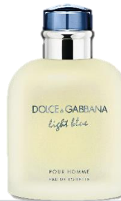
ライトブルー プールオム オードトワレ

25mL 7,000円(税込7,700円) 50mL 9,800円(税込10,780円) 100mL 13,100円(税込14,410円) 10mL 3,300円(税込3,630円)*