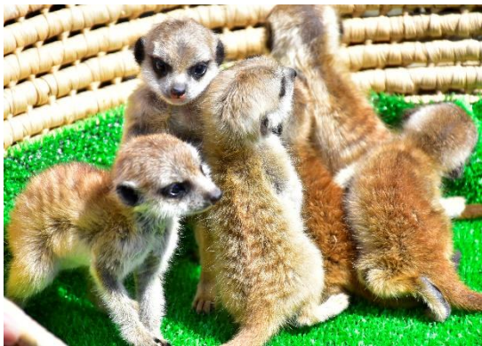
<場所> アニマルポート ミーアキヤット展示場(公開予定)