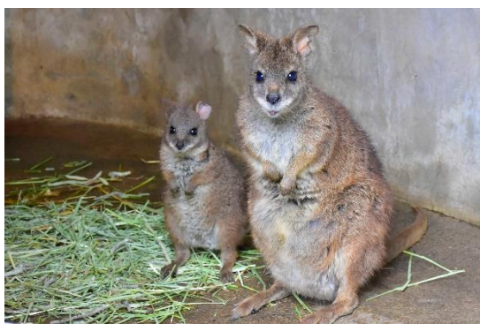
※4 月中は非公開です

【最近のマーラの赤ちゃんの様子】 「なかよし牧場」では現在、2 頭の赤ちゃんを一般公開しています。両親の後をついて歩いたり、同い年同士でくっついてじゃれたり休んでいたり、微笑ましいシーンを見ることができます。