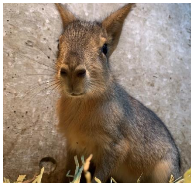
＜場所＞ なかよし牧場

【最近のワオキツネザルの赤ちゃんの様子】 普段は母親の背中にしがみついで生活していますが、最近では時おり母親から離れて一人遊びができるようになってきました。