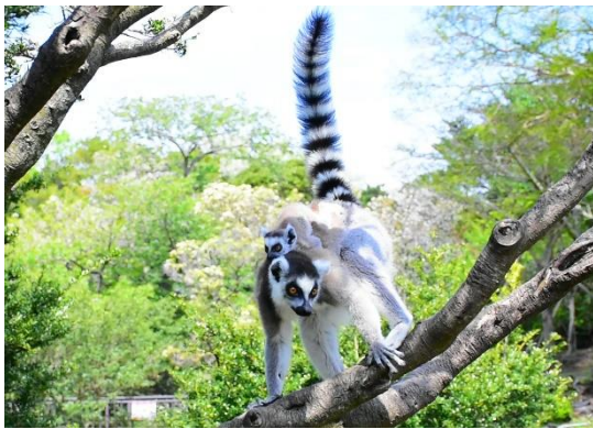
＜場所＞ アニマルポートツアーズ ワオキツネザルの島、クロキツネザルとリスザルの島