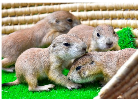
<場所> ロックガーデン プレーリードッグ展示場(公開予定)

【最近のヨザルの赤ちゃんの様子】 赤ちゃんは両親の背中にしがみついたり母親のお乳を飲んだり順調に成長しています。現在「タッチ de ZOO」1階の「わくわくモンキーハウス」にて、その愛らしい姿を見ることができます。