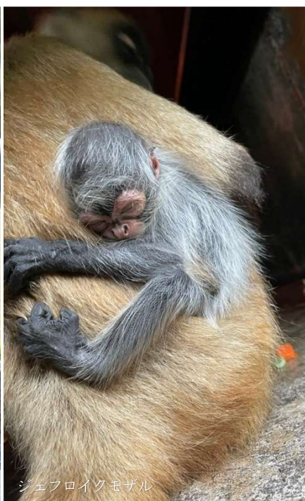
ジェフロイクモザル