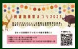
▲応募カード ※画像はイメージ

キャンペーン期間中に「阿波地美栄まつり」参加店舗を1店舗以上まわり、食事の写真と感想を応募フォームで送信。抽選で10名様にジビエの加工品やお肉をプレゼント!